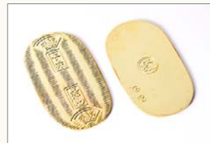
小判 950円(税込) サイズ:72×40mm