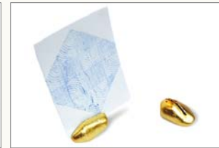
小石写真立て 950円(税込)