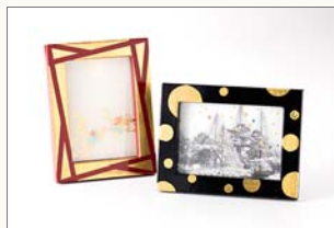
写真立て(全3色) 1,550円(税込) サイズ:125×164×12mm