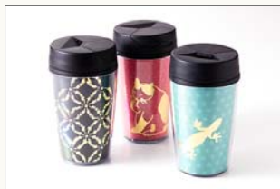
タンブラー(350ml) 1,350円(税込) サイズ:φ80×140mm