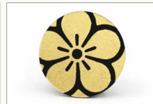
パッチ 600円(税込) サイズ:φ40×40mm