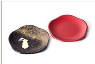
梅皿(黒・朱) 1,000円(税込) サイズ:φ140×12mm