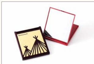
スタンドミラー(全5色) 1,350円(税込) サイズ:97×113×10mm