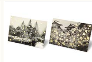
ハガキ2枚(全10種) 650円(税込) サイズ:100×148mm