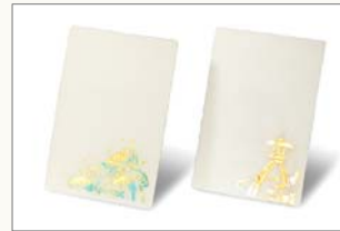
ハガキ2枚(全10種) 650円(税込) サイズ:100×148mm