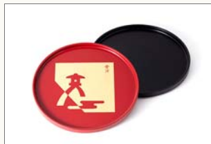
お盆(黒・朱) 1,350円(税込) サイズ:φ165×12mm