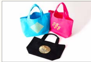
マイバッグ(全3色) 1,250円(税込) サイズ:300×200×100mm