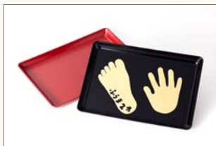
長角トレー(黒・朱) 1,550円(税込) サイズ:240×167×16mm