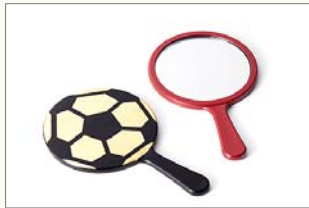
ミニ手鏡(黒・朱) 1,000円(税込) サイズ:φ73×120mm